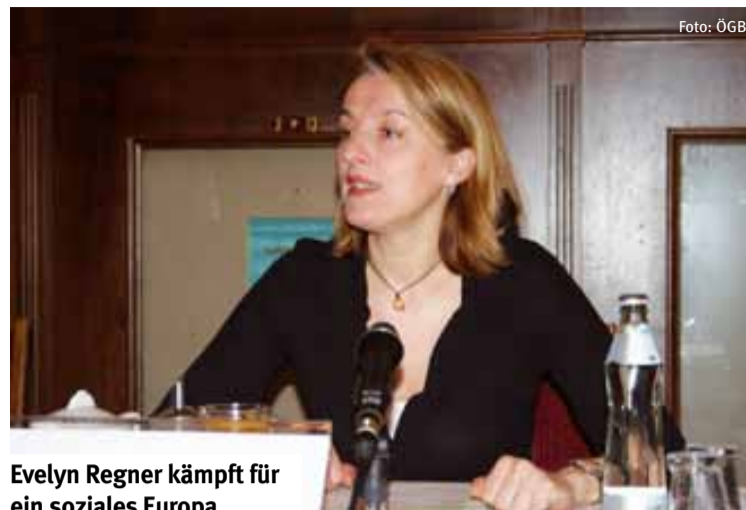
Evelyn Regner kämpft für ein soziales Europa.