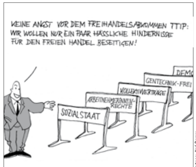
Cartoon: Karl Berger